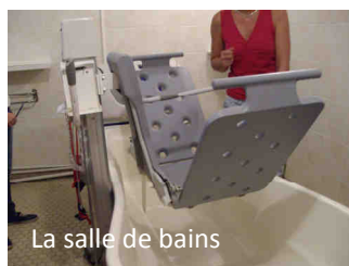
La salle de bains