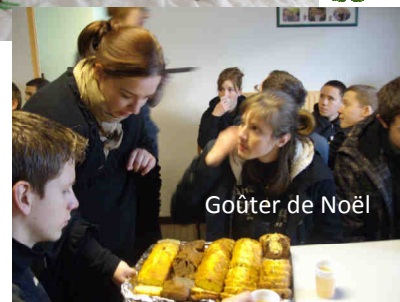
Gôûter de Noël